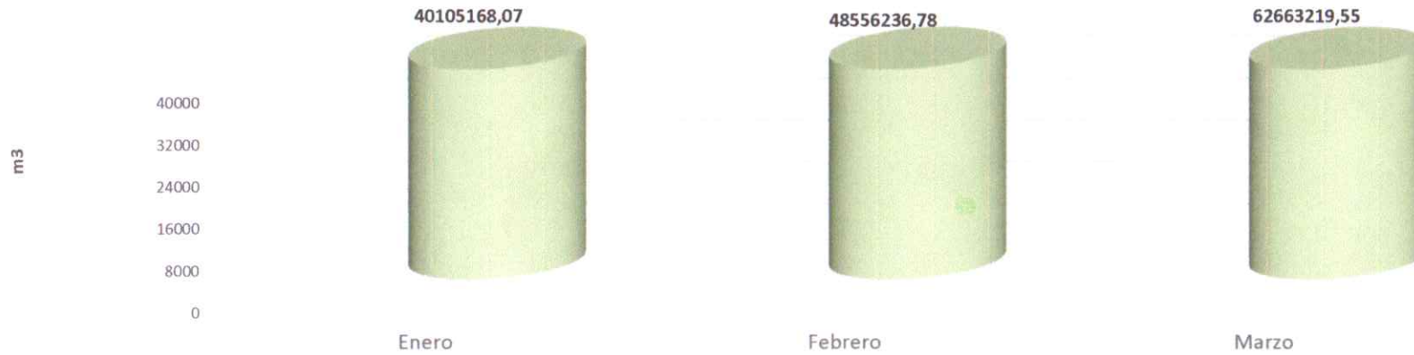
Ventas PETROPAR 2022

INICIÓ LA CONSTRUCCIÓN DEL NUEVO TREN DE MOLIENDA EN LA PLANTA DE MAURICIO JOSÉ TROCHE. Productores de caña de azúcar proveedores de la Planta Alcohola de Mauricio José Troche, vivieron un momento histórico en la verificación del inicio de obras para el nuevo tren de molienda que permitirá aumentar la producción de caña y, por ende, aumentarán las ventas para los productores de la zona. BAJAMOS LOS PRECIOS. El Gobierno Nacional en su esfuerzo por garantizar el beneficio de todos los paraguayos estableció la reducción de G 500 por litro en nuestros combustibles Diésel Porã y Nafta Oikoite 93 por 30 días, en toda la red de estaciones Petropar. Los nuevos precios rigen a partir de las 00:00 horas del 17 de marzo. De la misma manera desde el martes 22 de marzo, la Nafta Kape 88 se suma a los nuevos precios para el beneficio de todos los paraguayos. El nuevo precio vigente es G 6.860 en toda la red de Estaciones Petropar.