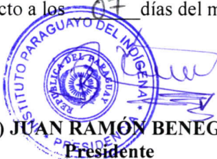
GRAL. DIV. (R) JUAN RAMÓN BENEGAS FERREIRA Presidente Instituto Paraguayo de Indígena

En prueba de conformidad, las partes suscriben el presente Convenio en 2 (dos) ejemplares de un mismo tenor y a un solo efecto a los 07 días del mes de enero del año 2025.