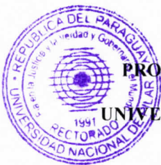
PROF. DR. VICTOR RIOS OJEDA Rector UNIVERSIDAD NACIONAL DE PILAR

En prueba de conformidad, las partes suscriben el presente Convenio en 2 (dos) ejemplares de un mismo tenor y a un solo efecto a los 12 días del mes de mayo del año 2026.